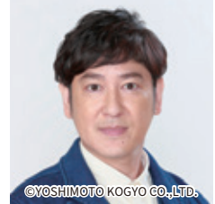
田中 直樹 氏 お笑い芸人 (ココリコ)